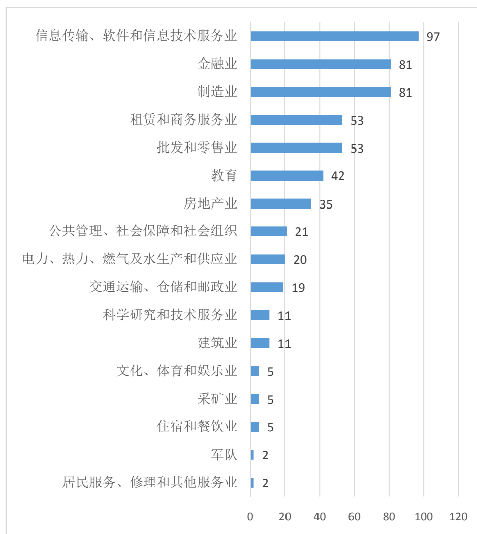
图 2 进校用人单位行业分布